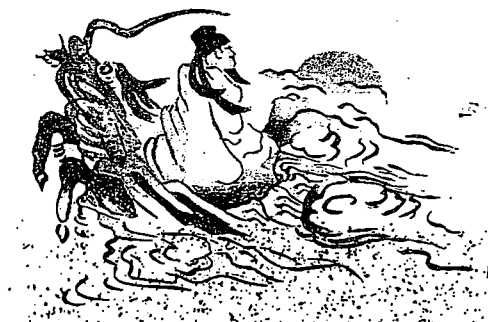
(社)日本美術院所蔵・四田観水画伯願、打出維久造氏願。

1.5世紀後、 海援隊尊皇 の坂本良馬が竜馬と改名して感応、土佐藩邸の道を隔てた隣・近江屋の実昇、キクが門左7世孫なる偶然に感激。近江屋を定宿とした新門辰五郎の縁で京都御所警護の徳川慶喜、駿府より新村青年(語学新出博士の兄)、御所より岩倉公も参加、近江屋茶室で公武合体会談。スペイン・イザベル、フェルナンド両王創案の巡礼道首部のHOSTAL人材収攬策に暗喩した門左が狙った近江屋活用遺策が奏効、尊皇倒幕遂に達成!幕末、門左理想「竜馬」像の縁で坂本竜馬、門左5年の長州滞在も奏効・桂小五郎、この両雄が門左7世孫の茶室に出現するまで魂魄幕藩体制を見据え、子孫に委託の尊皇倒幕宿願終に実現。